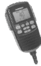
Nuotolinis Mikrofonas N° ACDC000